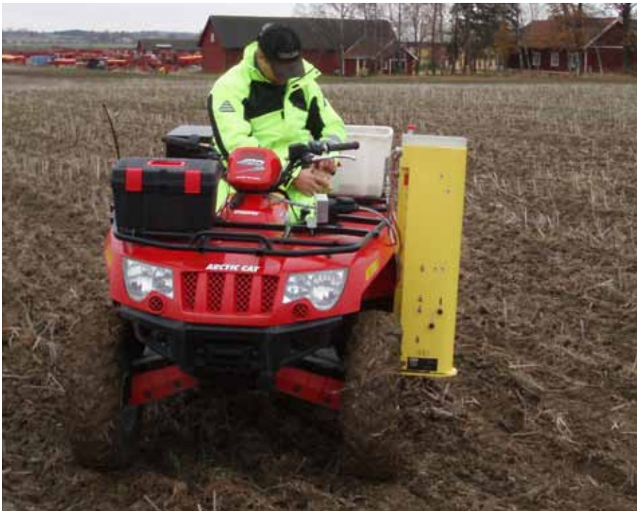
Modern provtagningsteknik för jordprovtagning

Prov med höga nummer skall ställas i botten av transportkartongen. Förvara proven så torrt som möjligt. Blöta prover bör sändas till laboratorium så snart som möjligt så att inte provkartongerna förstörs. Skicka med en fullständig ifylld beställningslista över vilka analyser som skall utföras.