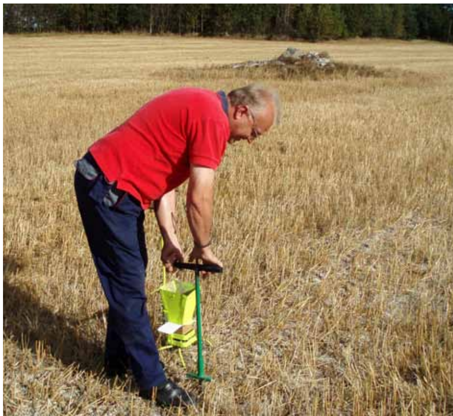
Hösten är bästa tid för markkartering

Omkartera vid samma årstid som senaste markkarteringen gjordes. Då undviker man att naturliga årstidsvariationer påverkar analysvärdena.